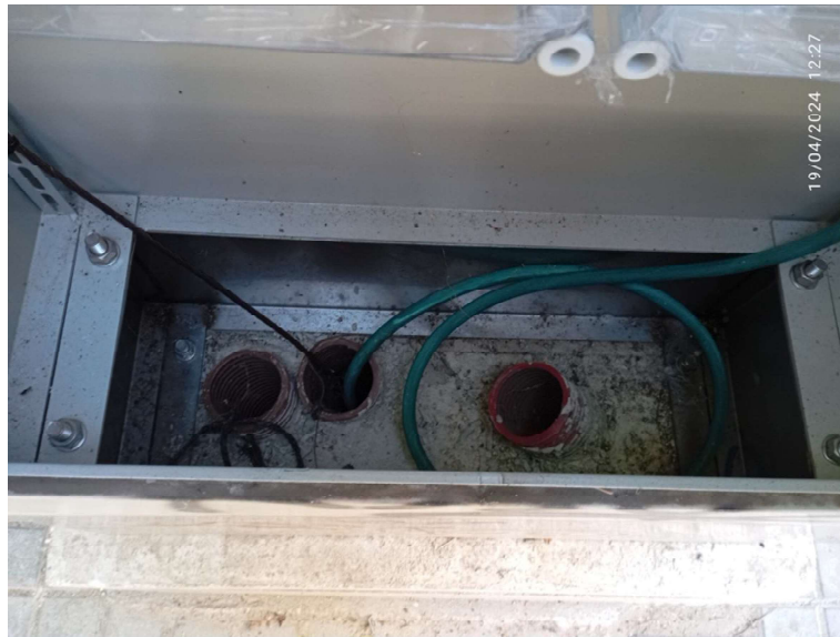
Foto 3 tubs entrada cablejat armari existent