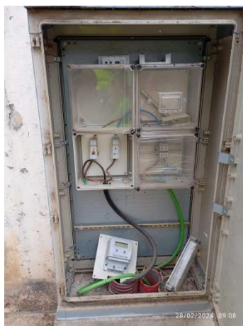
Foto 3 Interior armari existent