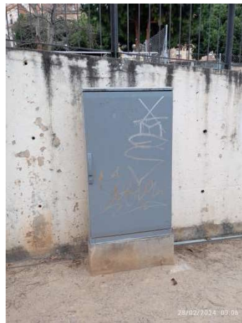
Foto 2 Armari existent