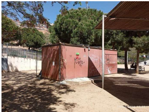
Foto 1 Ubicació armari respecte a la guingueta

L'armari existent de la guingueta (foto 2) consisteix en un model fabricat en acer inoxidable Aisi-304 a una cara pintat Ral 7032 format per un mòdul amb porta frontal. Mides totals 850x1350x320 (mides sense bancada). Equipat amb escomesa monofàsica normalitzada. Cal refer l'armari per dintre i fer les adequacions i tràmits necessàries per tal de garantir la contractació