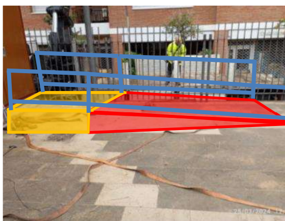
Espai rampa amb barana a executar