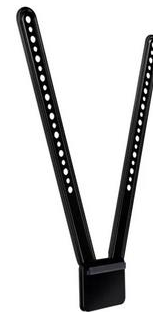
peça de muntatge de TV per MeetUp