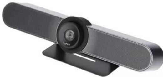
sistema videoconferència Logitech MeetUp