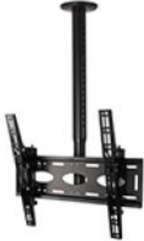
suport al sostre per a pantalles de fins a 65"