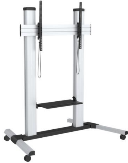
suport mòbil per a pantalles