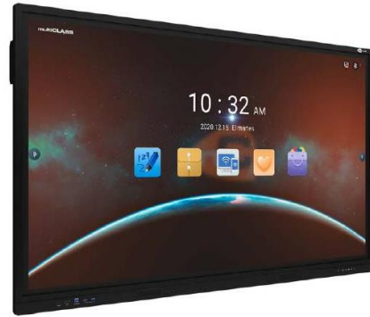
pantalla de 65"