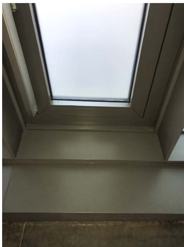
Fotos 8 i 9: Vistes detall de l'interior dels mòduls tipus de vidre fixe i d'exutori.