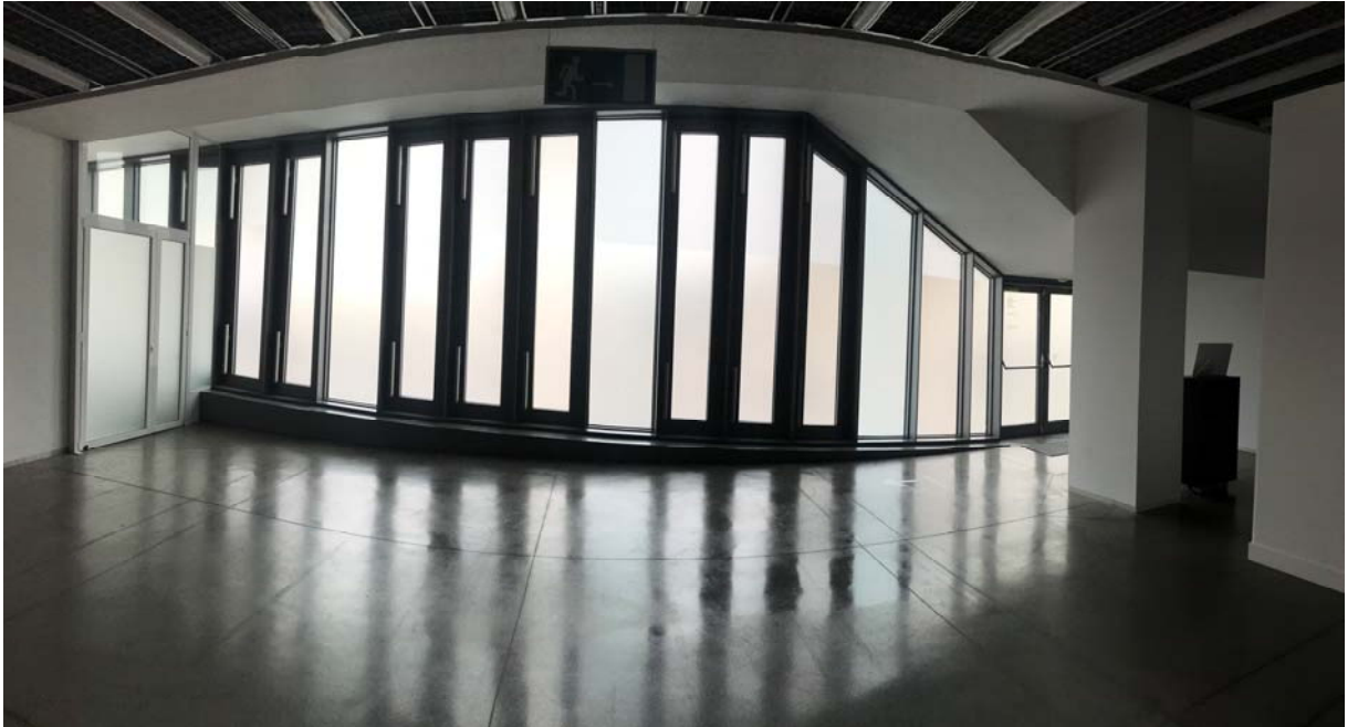
Foto 1: Vista general de la façana sala C, cara interior, zona d'actuació.