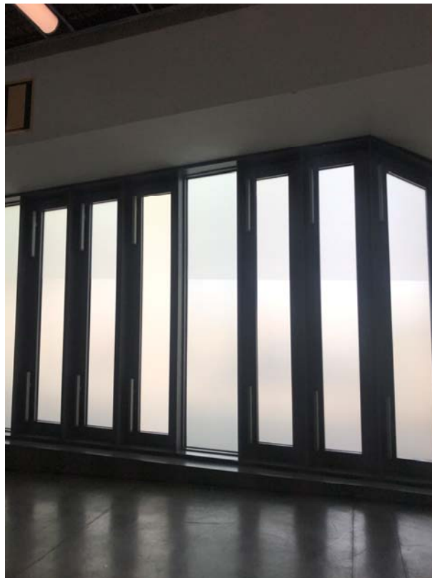
Fotos 4 i 5: Vistes detall de la façana, zona central amb exutoris existents.