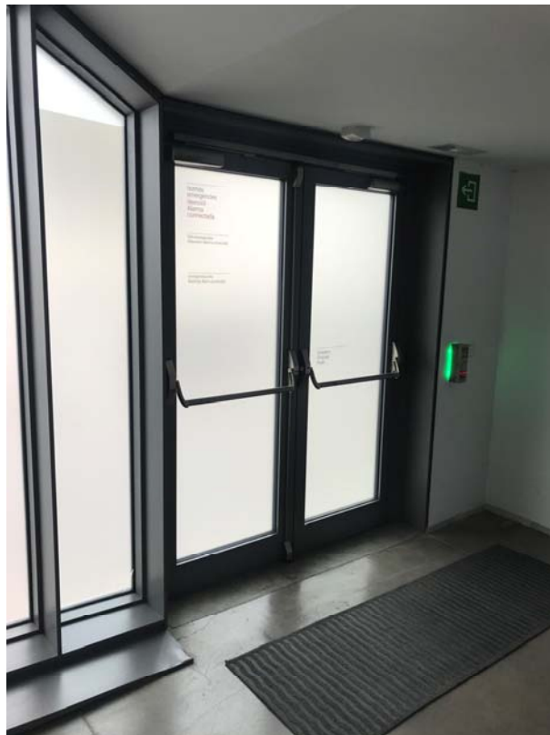
Fotos 2 i 3: Vistes detall de la façana, lateral esquerra i porta d'evacuació, Glòries 3.