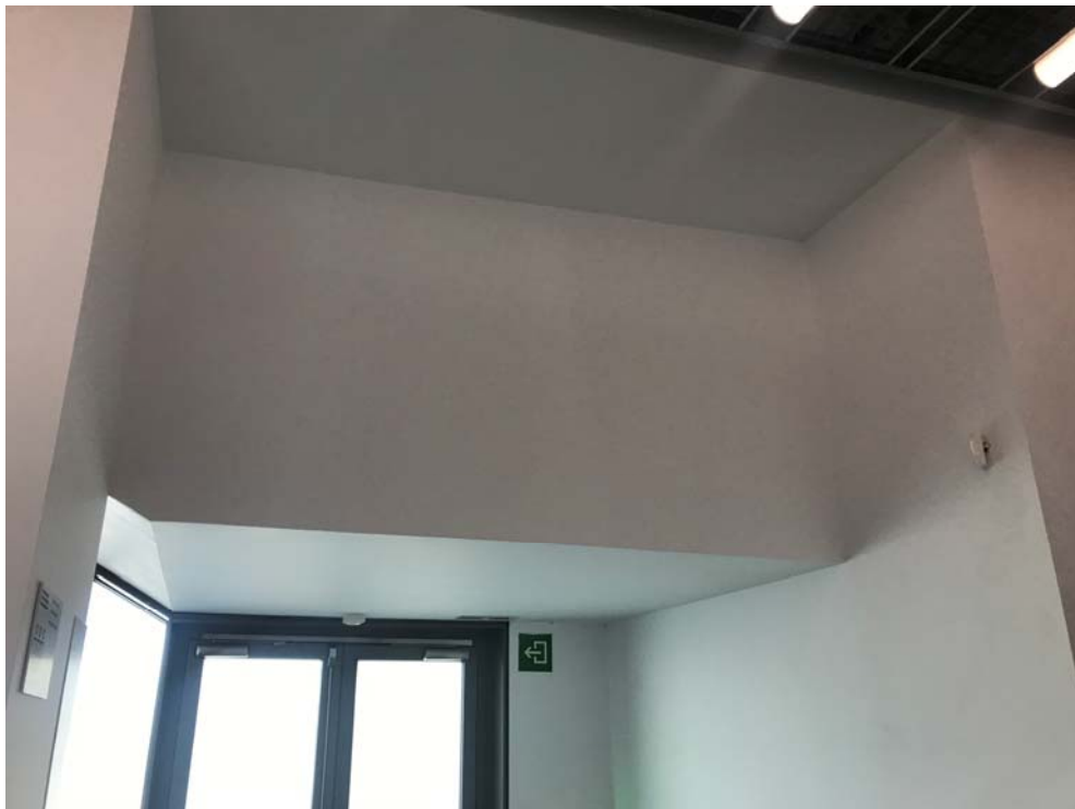
Fotos 6 i 7: Vistes detall de la zona porta d'evacuació, Glòries 3.