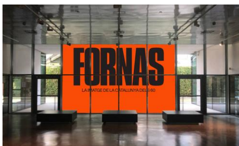
8 vinils amb el títol