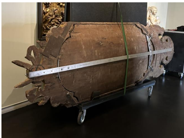
Detall del sistema de trasllat de la peça de la sala permanent a la temporal.

Aquests suports s'han desmuntat i utilitzat a l'exposició temporal sala 28, s'hauran de retornar al seu lloc a l'exposició permanent sala 27, tot a la 1a planta del MFM .