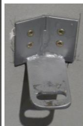
Detall dels suports de subjecció a paret amb angle. Detalls part superior i inferior.

Aquests suports s'han desmuntat i utilitzat a l'exposició temporal sala 28, s'hauran de retornar al seu lloc a l'exposició permanent sala 27, tot a la 1a planta del MFM .