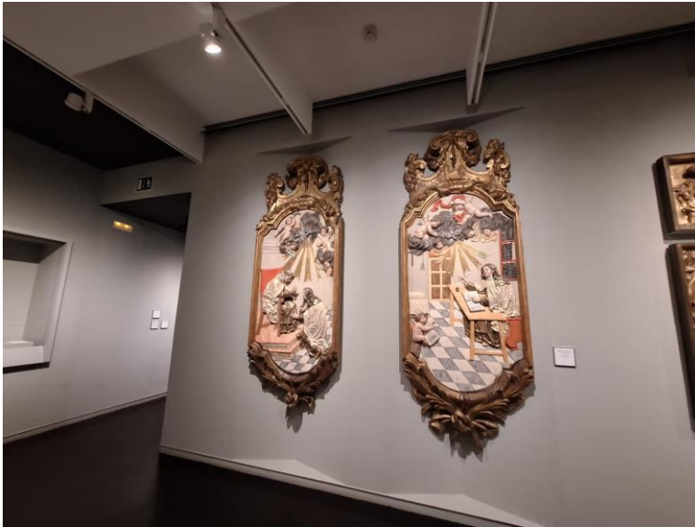
Lla peça està situada a la dreta de la imatge

SISTEMA DE SUBJECCIÓ A L'EXPOSICIÓ PERMANENT SALA 27 Plana 1 Escultura