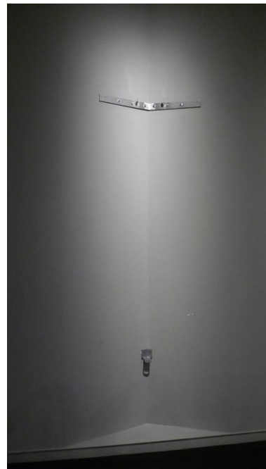
Anvers i revets amb el suport i elements de suport a paret, que s'han aprofitat per a la instal·lació a l'exposició temporal.