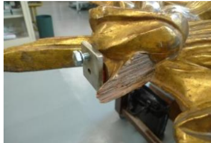
Detall del sistema de subjecció adaptat a la peça, part superior e inferior