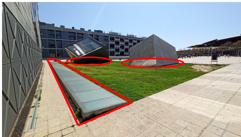
Lluerna lineal i lluernes cúbiques

El present contracte contempla la substitució de la totalitat del segellat de la lluerna lineal horitzontal i el segellat del sòcol perimetral de les lluernes cúbiques de la Biblioteca El Clot – Josep Benet. Els treballs es realitzaran a nivell de paviment exterior.