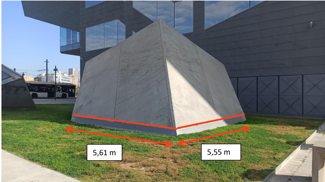
Afectació a tot el perímetre de la lluerna.