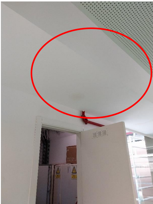
3. Connexió instal·lació AF clima.