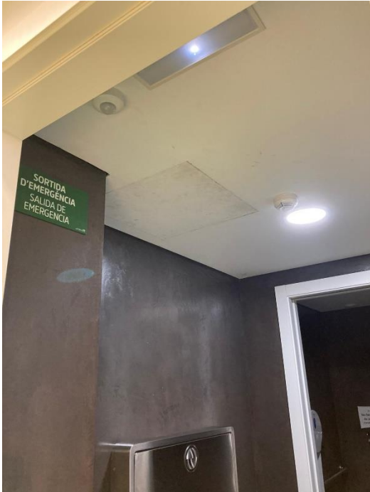
5. Registre fals sostre wc infantil PB