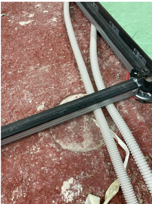
7. Passa-tubs existent