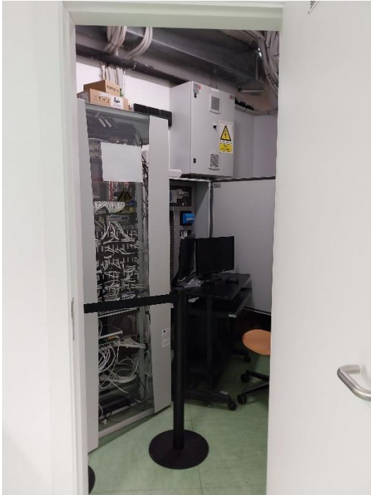
1. Sala a climatitzar