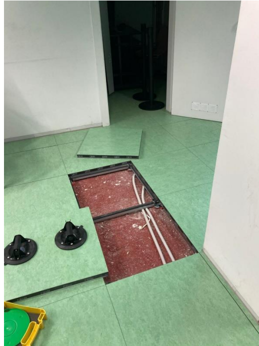
6. Zona passa-tubs forjat planta primera