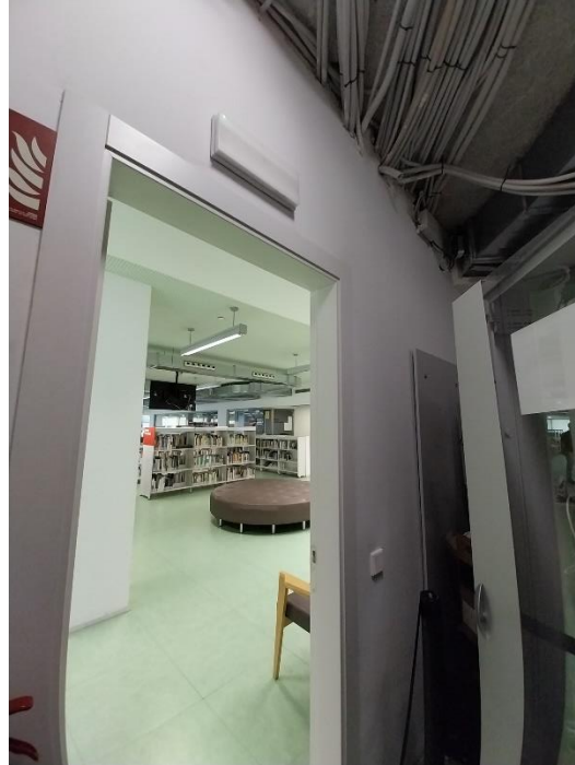
2. Ubicació climatitzador