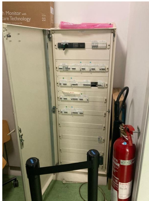
4. Quadre connexió elèctrica