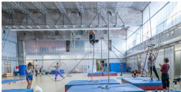
SALA ENTRENAMENTS. FOTOGRAFIA F2