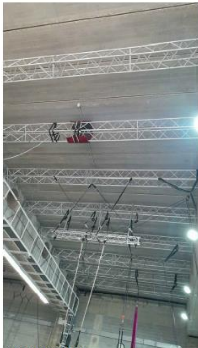
SALA ENTRENAMENTS. FOTOGRAFIA F1