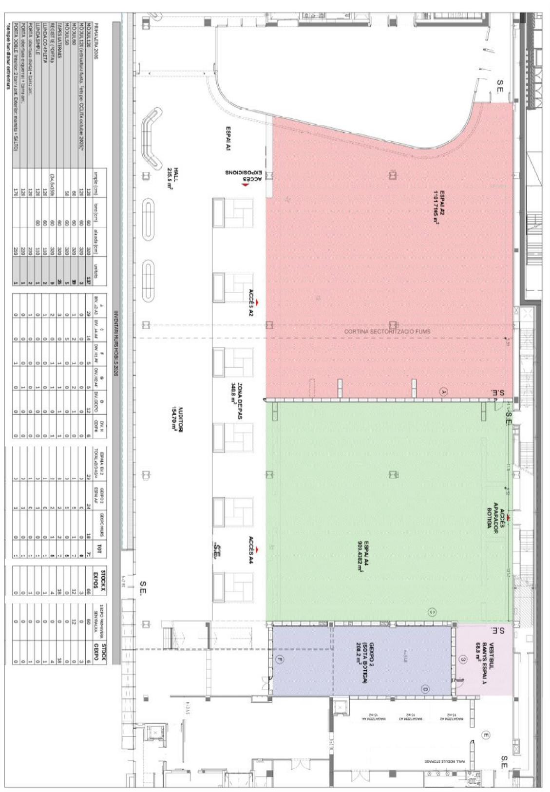
Planta de l'espai expositiu amb distribució de les parets modulars per dividir l'Espai A en dos, Planta B. PLÀNOL 2 – PLANTA TARDOR 2026

Disseny Hub Barcelona Pl. de les Glòries Catalanes, 38 08018 Barcelona + 34 93 256 67 00 dhub@bcn.cat