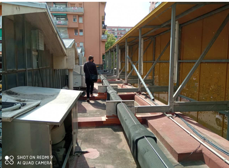
Fotografia Façana Carrer Puigcerdà