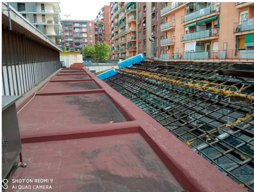
Fotografia Façana posterior

Institut Municipal de Mercats de Barcelona Departament Tècnic C/ Gran de Sant Andreu 200 08030 Barcelona Telèfon: 93 4132875 www.bcn.cat/mercats