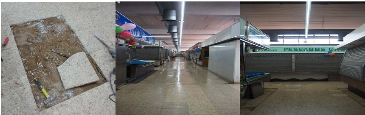
Il·lustració 2 Paviment zona ventes i cala a on es comprova que no hi ha base de formigó

Per aquest motiu s'inclou l'enderroc del paviment existent a la sala de ventes i així com la formació d'una solera de formigó que serveixi com a base estructural i poder instal·lar un nou paviment de terratzo.