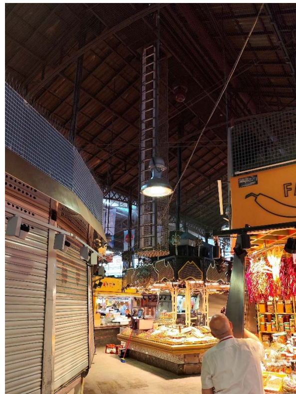
Vista des accessos a les plataformes existents sota els careners de les tres naus

Els principals elements a inspeccionar, son: