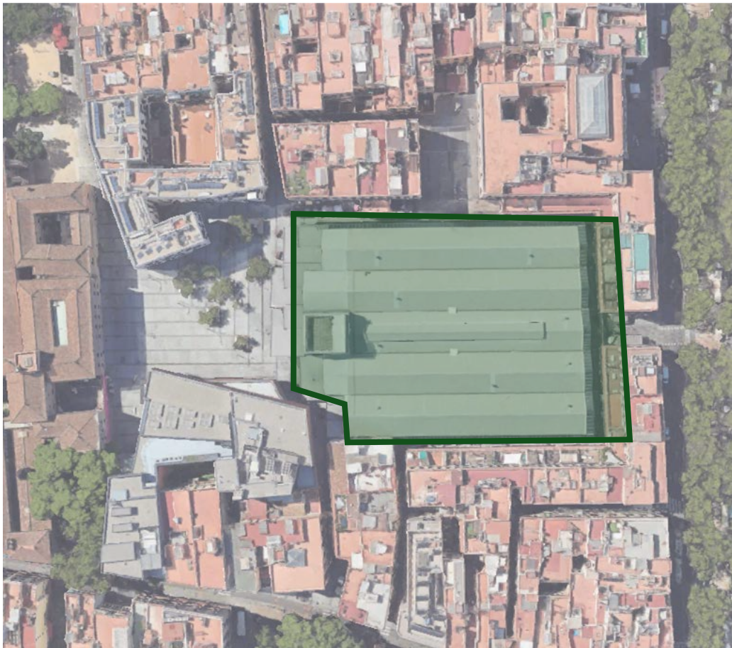
Planta emplaçament àmbit intervenció